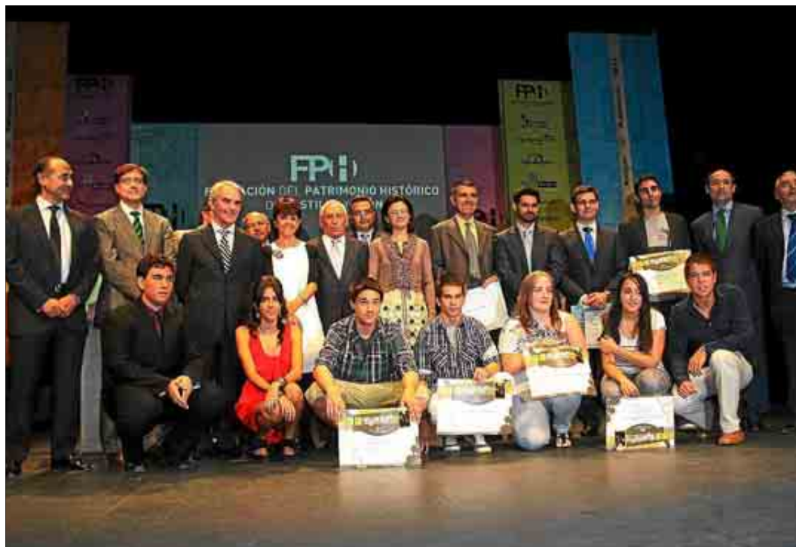
Foto de familia de los premiados y los representantes de la Fundación.

Los premios «Los nueve secretos» fueron para los institutos «Giner de los Ríos» (Segovia), «Diego de Praves» (Valladolid), «La Vaguada» (Zamora); «La Albuera» (Segovia); «Trinidad Arroyo» (Palencia), «Tierras de Abadengo» (Lumbreras-Salamanca); «Tierra de Campos» (Villalpando-Zamora) y el Colegio Nuestra Señora de Saldaña (Burgos).