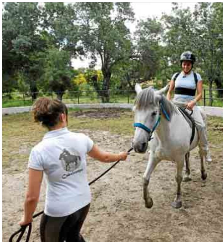
Clases de equitación en un alojamiento rural.

Igualmente, el grado de ocupación en la Comunidad por plazas se situó en agosto en el 29,63%; el fin de semana en el 38,22% y, por habitaciones, en el 34,47%, frente a porcentajes en España del 37,25; 44,8 y 42,44%, respectivamente.