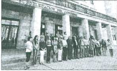
Concentración contra la violencia de género.