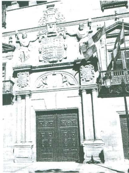
Palacio de los Condes de Gómara.