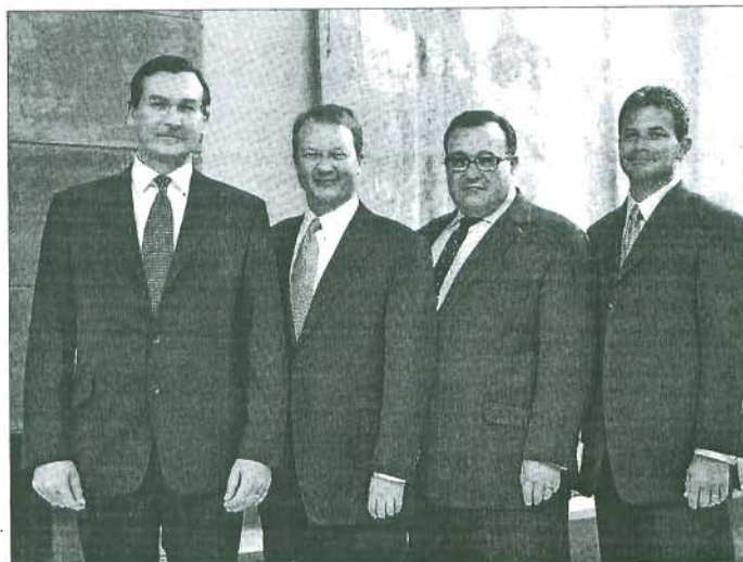
Los responsables de SNR Denton, firma resultante de la unión de Sonnenschein y Denton.

Otro dato importante que revela el informe es que la actividad de apertura de oficinas se mantiene al alza en el